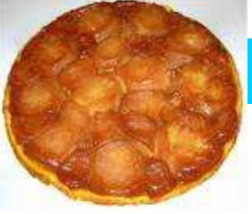
La Tarte Tatin