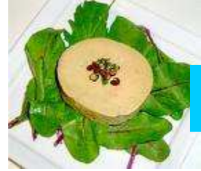
Le foie gras