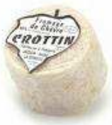
Le crottin de Chavignol