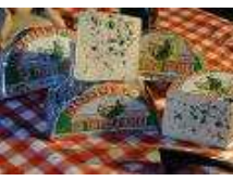
Le roquefort Le Rocamadour