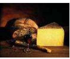
Le cantal Le bleu d'Auvergne