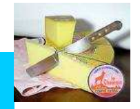
Le comté Le Mont d'or