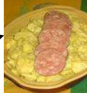
La Saucisse de Morteau