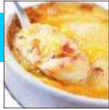
La Tartiflette en Savoie