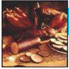
L'andouillette de Guéméné